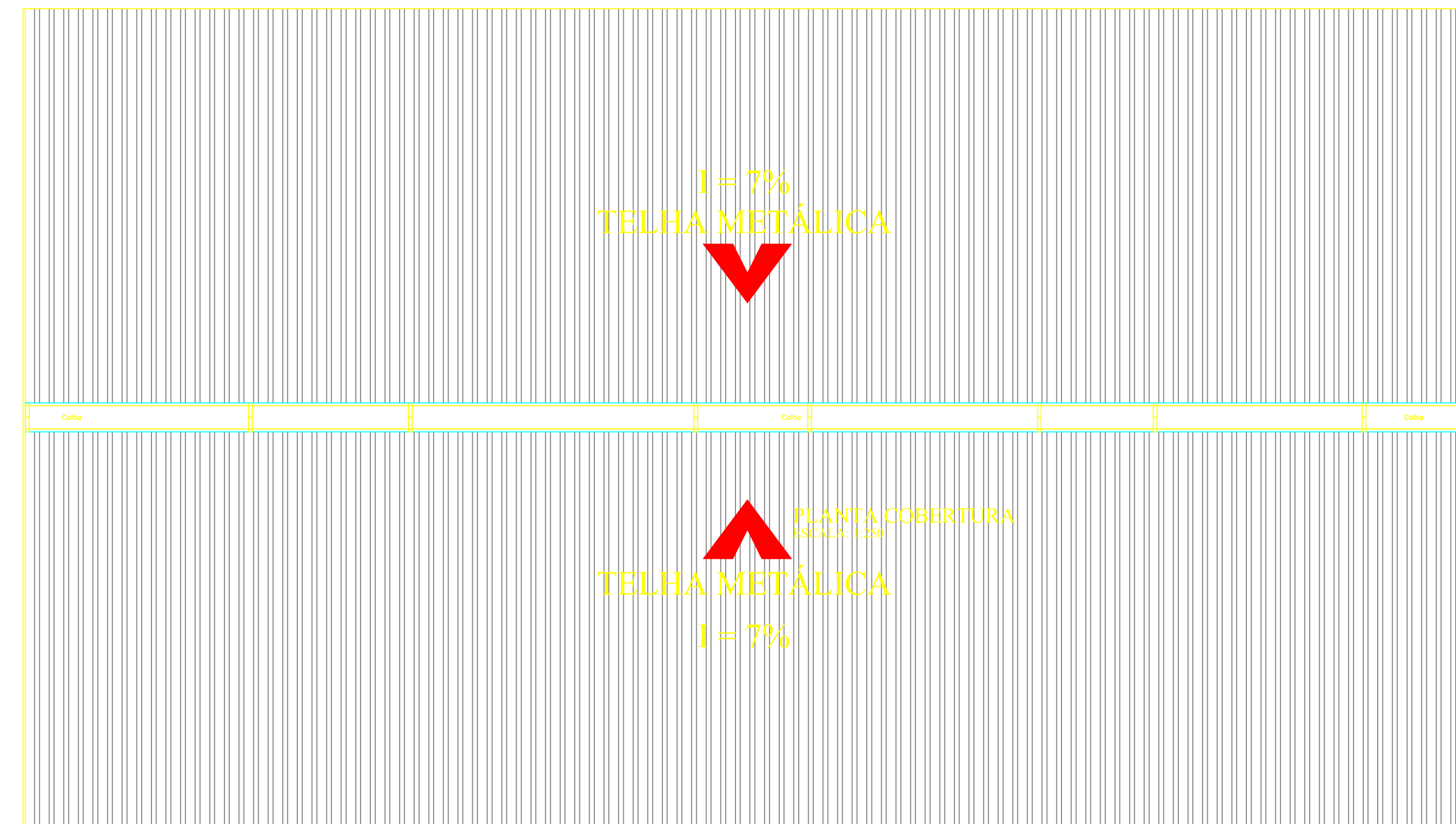
PLANTA COBERTURA ESCALA: 1:100